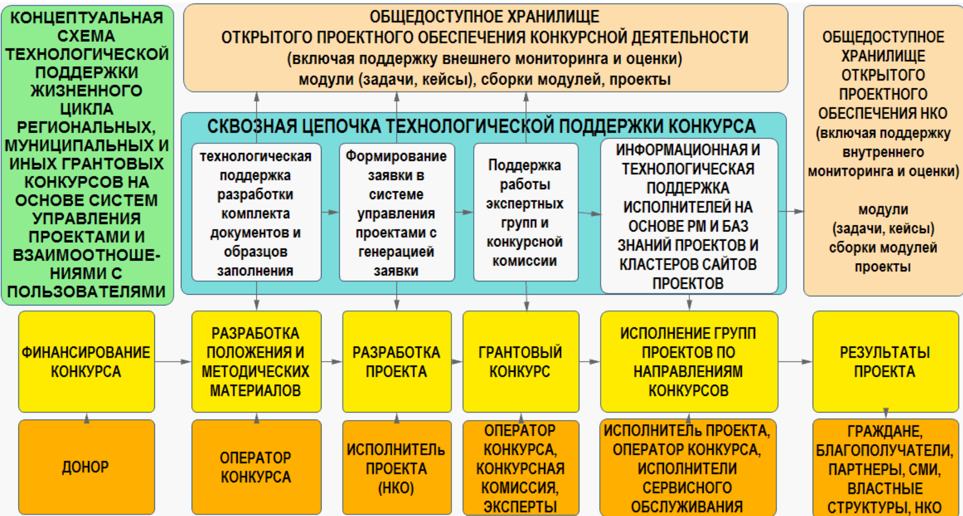
СХЕМА СКВОЗНОЙ КОНКУРСНОЙ ПОДДЕРЖКИ СОЦИАЛЬНЫХ КОНКУРСОВ ДЛЯ НКО